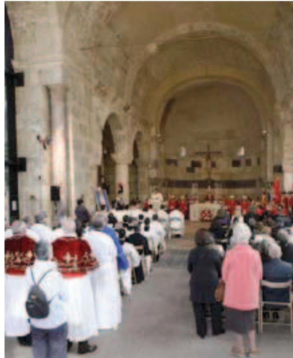
L'interno della basilica di San Saturnino [UNGARI]

IL MUSEO. Il piano di recupero si conclude con la realizzazione di una struttura di accoglienza nella "ex casa del custode" e con la musealizzazione all'aperto dell'area, integrata da appositi pannelli didascalici, oltre alla creazione di soste attrezzate per la sosta dei visitatori. (a. a.)